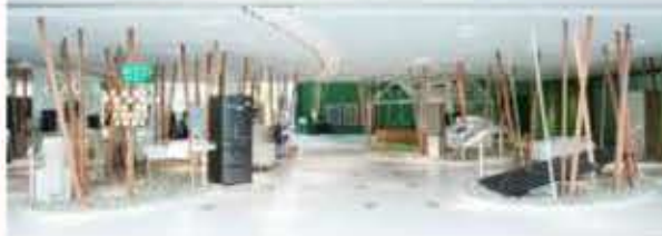
①A パナソニック東京の外観と内部展示