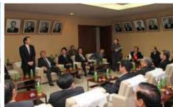
②B ベトナム内務省幹部の議会訪問