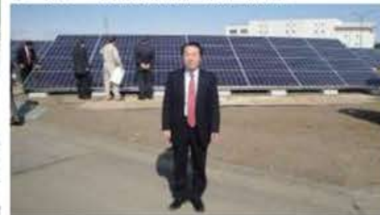
③C 県行田浄水場視察