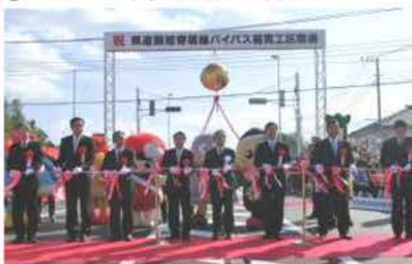
④D 県道飯能寄居線バイパス開通式(左)・完成直後の飯能寄居線バイパス(右)