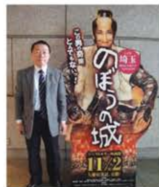
議事堂ロビーにて