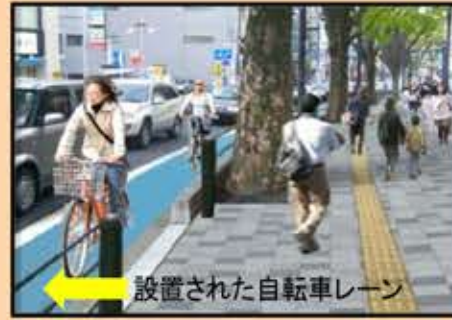
設置された自転車レーン

◆歩道の排水溝のふたを細めタイプにして、つえや車椅子を使用する人に支障のないようにします。