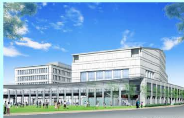
完成予想イメージ