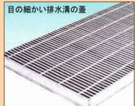
目の細かい排水溝の蓋

◆歩道の排水溝のふたを細めタイプにして、つえや車椅子を使用する人に支障のないようにします。