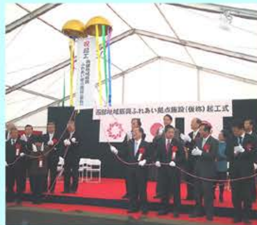
平成25年1月12日起工式が行われました。

東武東上線川越駅の西側に、県西部のコミュニティ拠点として整備される施設です。総額128億8,854万円で落札されたので、議決が求められました。内訳は、建物工事2件、電気設備、機械設備(空調)、給排水設備の5件です。いずれも、工期は平成27年1月30日です。