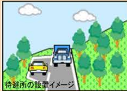
待避所の設置イメージ

◆交通量が少ない道路は、1車線でも、待避所の間隔を短くしたりして、県道として認められます。