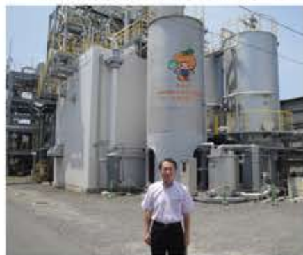
▲バイオ燃料プラント