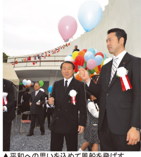
▲平和への思いを込めて風船を飛ばす