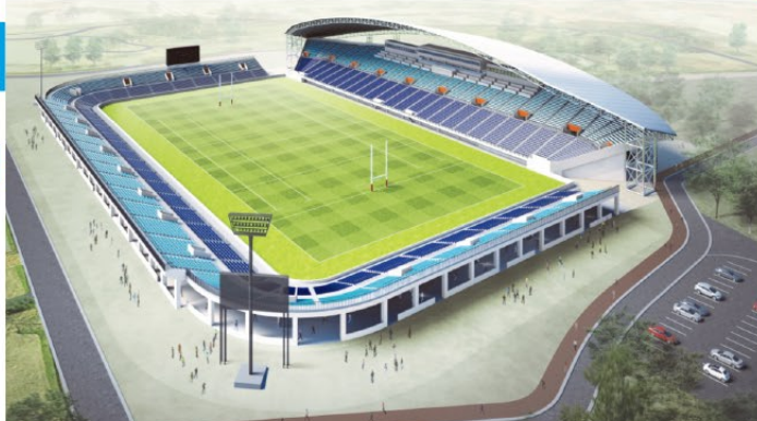
「ラグビーワールドカップ2019」は平成31年9月～10月(約7週間)にわたって全国12都市で48試合が行われ、20か国の代表チームが出場します。本県では県営熊谷ラグビー場(上記イラストイメージ)で3試合程度が行われます。