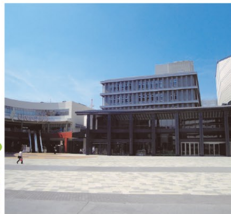
▲十分なスペースのある広場

1,700名を収容できる大ホールや多目的ホールや県地方庁舎などが集まった公共施設と民間商業施設が一つになった複合拠点施設が完成しました。ホールは7月から公演が始まります。