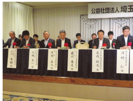
▲県獣医師会定時総会での祝辞