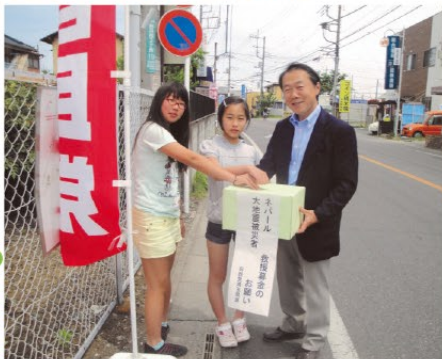
▲小学生も募金に協力してくれました

ネパール地震被災者を救援するための募金活動を行いました。2日で60,571円が集まりました。皆様から頂いた貴重な募金は自民党本部を通じて、被災者支援に使わせていただきます。