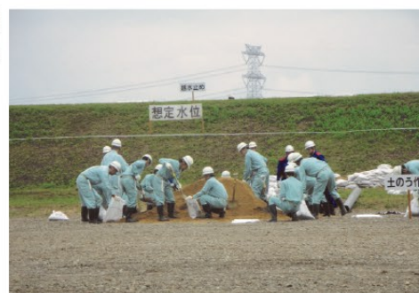
▲土のうづくりをする水防団の皆さん