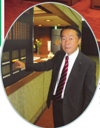
2期目の初登庁 登庁ランプを押したところ。