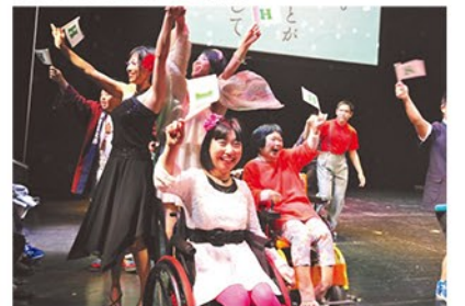
▲障害を感じさせない見事な演技