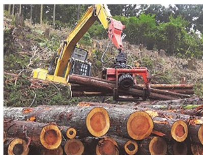
▲こだま森林組合の木材伐採現場

ホンモロコを養殖している掛川養魚場(熊谷市妻沼)、こだま森林組合の木材伐採現場(神川町)、「武蔵牛」のブランド名の牛を育成・販売する、さかい牧場(深谷市今泉)を視察しました。