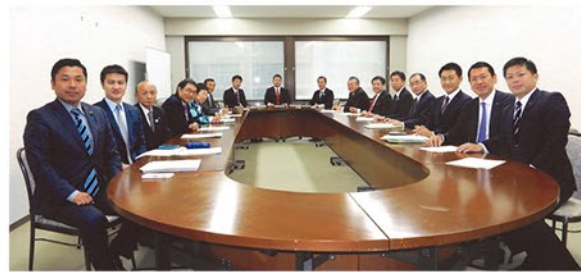
▲政務調査会にて条例協議に臨むメンバー