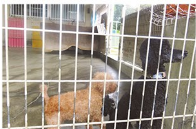
▲保護されている犬

同センターでは、引き取った動物の飼い主探しを行うボランティア団体との連携により、平成27年度まで3年連続で犬の殺処分ゼロ、2年連続で猫の殺処分ゼロを達成しました。