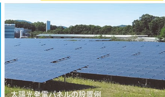
太陽光発電パネルの設置例