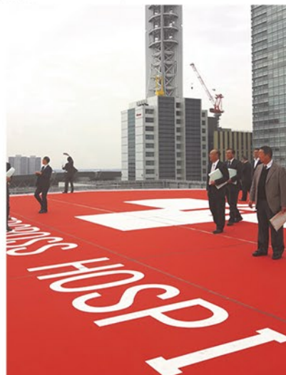
▲日本赤十字病院の屋上ヘリポート

懇話会では、さいたま新都心医療拠点施設である埼玉県小児医療センターと日本赤十字病院を視察しました。