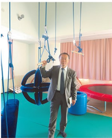
▲運動機能回復のためのリハビリ器具

●福祉医療センター港南(横浜市) 重症心身障害医療・福祉における横浜市の中核施設として、平成28年6月にオープンしました。重度心身障害児(者)施設としては、国内初の本格的ユニットケア(自宅と同じような住環境)を備えています。