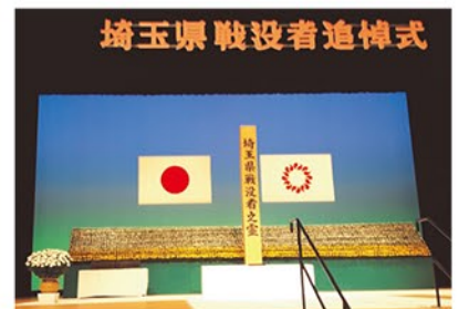
▲戦没者追悼式典の様子

福祉保健医療委員会副委員長として出席。毛呂山、越生、鳩山3町の遺族会の方々も出席しました。