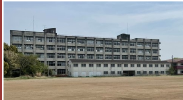
▲解体設計の予算が計上された旧毛呂山高校跡地

かねてから旧毛呂山高校跡地の早期活用を県に求めていましたが、令和5年度予算に、跡地の売却に向けて校舎解体のための設計委託費約2,000万円が計上されました。これにより、ようやく跡地活用のための手続きが動き出します。