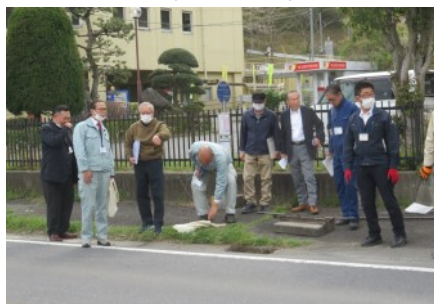
▲県職員と現場を確認(R7.4.10)

県道ときがわ坂戸線の鳩山町役場付近での雨水対策について対応を求めため、地元区長さん方と共に東松山県土整備事務所に要望しました。(4月24日)