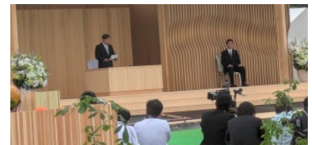
▲式典での陛下のお言葉

全国植樹祭が、昭和34年の第10回以来66年ぶりに、秩父市のミューズパークで開催されました。式典行事では、ダンスなどのパフォーマンスが披露されるとともに、天皇陛下によるお手植え、お手播きなどが行われ、会場は盛り上がりました。(5月26日)