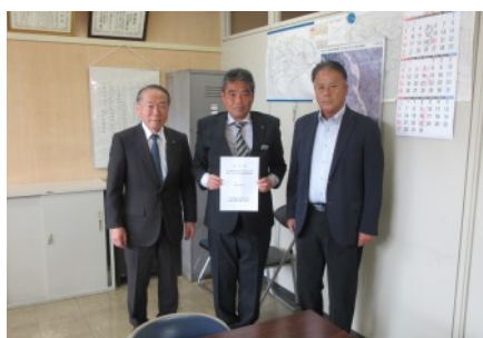
▲所長に要望書を手渡す