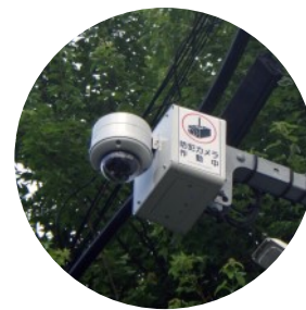
▲鳩山小付近に設置された防犯カメラ

「犯罪を起こさせにくい環境づくり」を進め、犯罪のない安心で安全な地域社会の実現をめざす鳩山町の町内防犯カメラ設置事業が県補助事業に採択されました。令和7年度は、町内主要交差点を中心に防犯カメラ3台を設置するもので、内示額は121万円です。なお、令和6年度の補助については、鳩山町3台(45万円)、毛呂山町6台(157万5千円)でした。