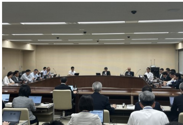
▲6月27日に開催された委員会の様子