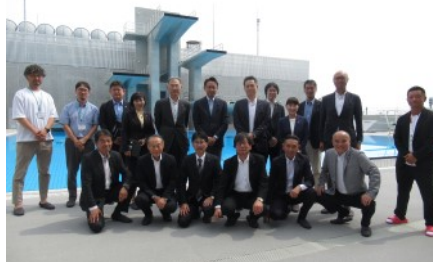
▲国際基準を満たした飛び込みプール

令和6年国民スポーツ大会・全国障害者スポーツ大会開催を契機に、アリーナ、水泳場、スタジアム、総合体育館などが一体的に整備されたスポーツ施設を視察しました。県ゆかりのトップアスリートの育成と県民のスポーツを楽しむ健康づくりをめざした県の「SSP構想」を軸として進められています。(5月28日)