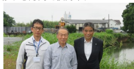
▲東松山県土事務所長、副所長と