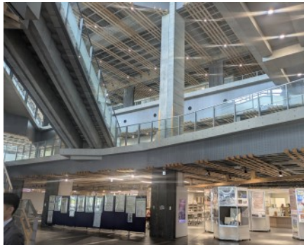
▲県庁入り口のオープンスペース

築70年を超えた埼玉県庁舎の再整備に向けて参考にするため、同県において平成30年に新庁舎に建て替えた経緯、建物などを視察しました。(5月29日)