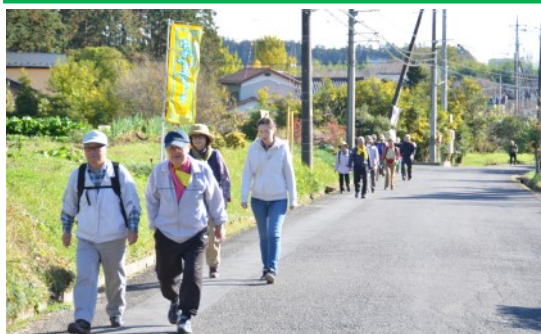
▲復活をめざすゆずの里ウォーク