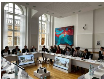
▲ポツダム大学での協定書締結式

また、ポツダム大学を訪問し、同大学と埼玉大学・獨協大学との間で結ばれる、職員交流・学術協力に関する協定書締結式に立ち会