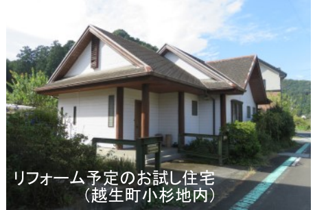
▲リフォーム予定のおとし住宅(越生町小杉地内) ※2か年事業として、来年度も県補助を要望する予定です。

今年度は、町が梅園地域の空き家を取得し、建物のリフォーム設計を行います。来年度は、建物のリフォーム工事を行い、事業を開始する予定です。