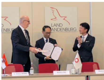
▲共同声明の更新(首相、知事、議長)

ベルリン市内では、野菜やハーブなどをタワー型の装置を使って栽培する都市型農場「ポタジュファーム」を視察し、今後の都市型農業の在り方について参考としました。