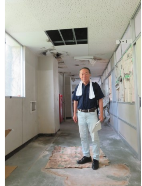
▲老朽化した校舎内部の様子

跡地の取得に関心のある事業者、県教育局、毛呂山町の職員、県議が校内の状況を視察しました。(9月3日)