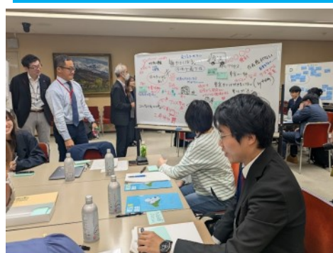
▲若者らしい意見が続出