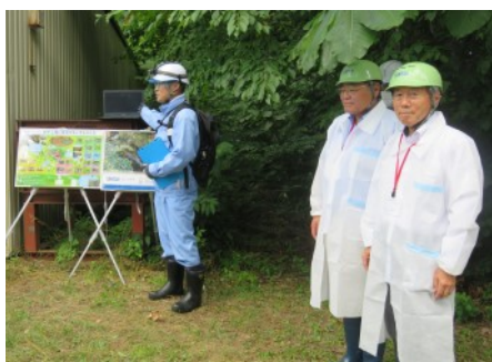
▲ピオトープを整備した工場内

◆積水メディカル(株)岩手工場 (岩手県八幡平市) 十和田八幡平国立公園に隣接する同社では、医薬品の製造を行っています。環境配慮型の技術を活用し、自然環境との調和を図りながら持続可能な生産活動を行っています。(7月28日)