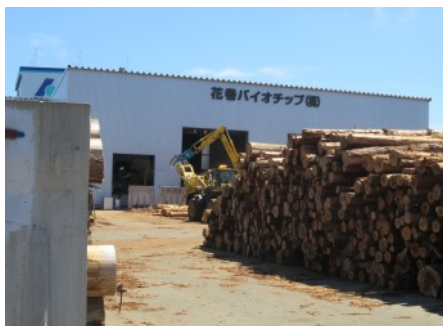
▲場内に積まれた原料の木材

同社は、保有する森林の植林、間伐、未利用材の調達から木質バイオマス発電用木材チップの製造・供給、発電まで一貫体制で取り組んでいます。(7月29日)