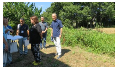
▲現場の状況を聞く職員

毛呂川(毛呂山町平山地区)の浚渫について区民の方から要望があり、飯能県土整備事務所に状況確認を依頼しました。(9月3日)