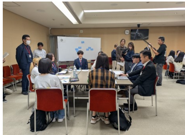
▲意見交換会の様子(県議会議事室内)