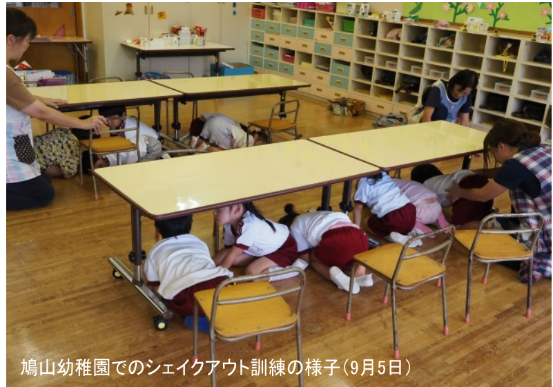
鳩山幼稚園でのシェイクアウト訓練の様子(9月5日)

この訓練を通じて、災害伝言ダイヤルの体験利用や避難経路・場所の確認なども実施し、広く防災意識の向上が図られました。