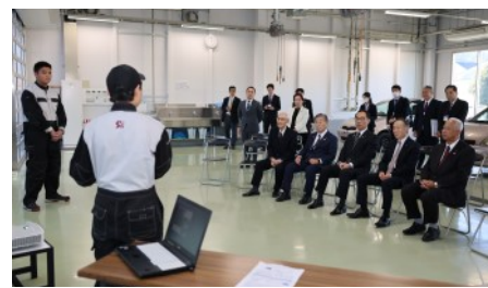
▲自動車科の生徒による説明

同校は、通信制高校で全国唯一の自動車科と調理科を設置しています。また、令和5年度に私立高校で全国初の「マイスター・ハイスクール」の国の指定校となり、地元越生町の課題解決に向けた取組を生徒が行っています。