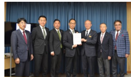
▲知事へ要望した3協議会のメンバー