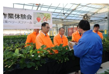
▲ハウス内でイチゴ苗が育っている様子

同社では、アグリ事業部門で2020年からイチゴ苗を無菌状態の施設で液体培養し最新技術で育て、農家に提供しています。昨年、県の農業大賞革新技術部門大賞を受賞しています。