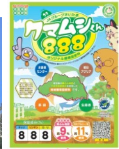
▲肥料のパッケージ