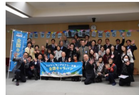
▲参加者の皆さんと