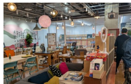
▲Miacis(ミアシス)施設内部の様子

当施設は、「中高生にとっての家でも学校でもない第3の居場所」をコンセプトに開設された山梨県内初のユースセンターです。中高生が自由きままに過ごせる場所で、同年代との交流のみならず、進路や学校の悩みなどの相談もできます。Miacis(6,500年前に生息し多様な進化を遂げた動物)のごとく、自分の選択次第で