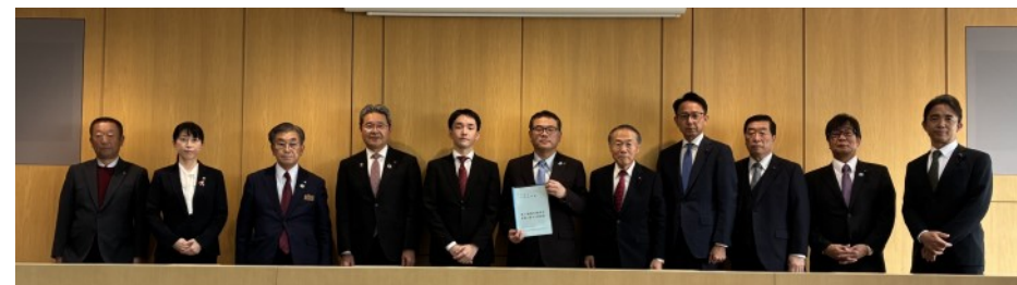
要望に出席した首長及び県議会議員