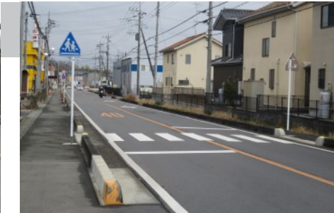
▲毛呂山町市場地内(新設)