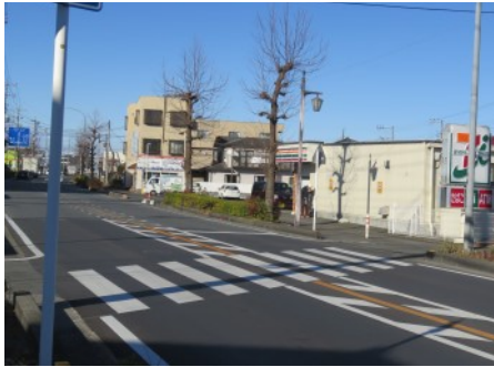
▲毛呂山町岩井地内