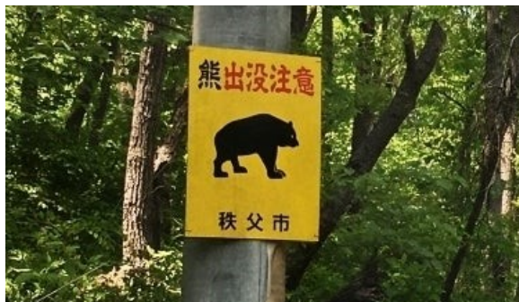
▲クマへの注意を促す秩父市内の看板