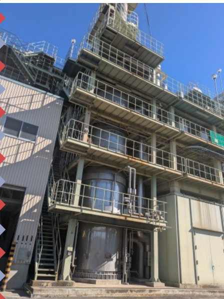
▲高温で汚泥を焼却する焼却炉

県では、下水汚泥が年間約50万トン発生します。これまで、その90%を焼却して軽量骨材の原料にしてきましたが、令和5年に焼却灰をそのまま肥料にすることとしました。「荒川クマムシくん1号」と名付け、りん酸が24.3%と高濃度で含まれることから、行政としては初めて埼玉県がこの規格の肥料登録をしました。この肥料を製造しているのが戸田市にある荒川循環センターです。