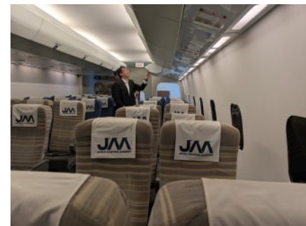
▲実物さながらの訓練施設

同校は、国内最大・最古の航空従事者養成を行う私立高等学校です。特に、国内で唯一、航空機パイロットやキャビンアテンダントなどを養成する航空科を有しており、日本航空大学と連携した高大一貫教育を行っています。また、普通科ではスポーツ、芸術などのコースもあり、生徒の得意分野を伸ばすことを目標としています。