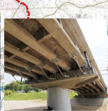
▲⑪耐震補強工事完了後の春日橋