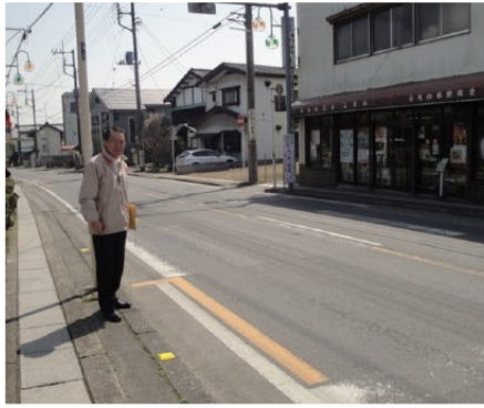
▲消えかかった横断歩道を調査中 (事務所近くの県道飯能寄居線)