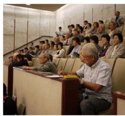
▲第2回目の議会傍聴に参加の皆さん