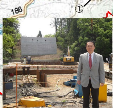
★飯能寄居線BP 新高麗川橋工事現場