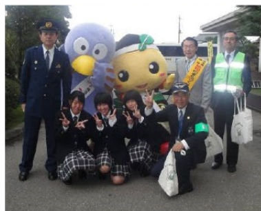
▲埼玉県防犯キャンペーンに参加