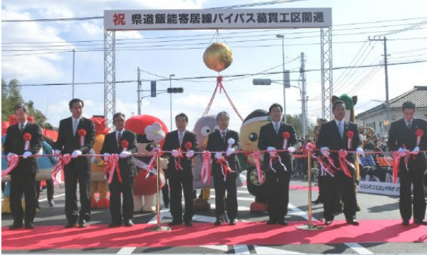
▲①飯能寄居線バイパス葛貫工区開通(H24.2月)