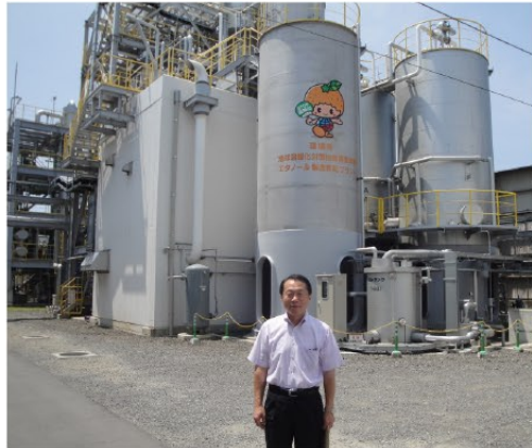
▲バイオマス燃料プラントを視察(愛媛県)