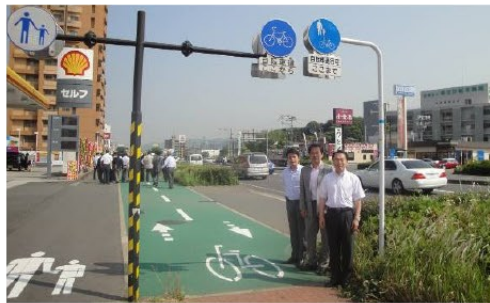
▲県土都市整備委員会の視察(北九州市)