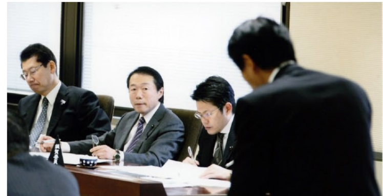
▲産業労働委員会での質疑の様子