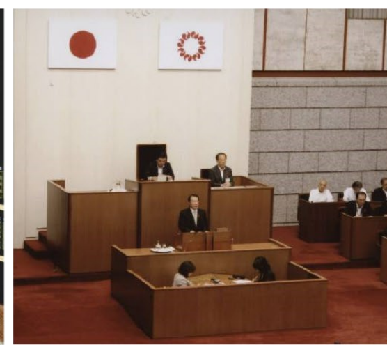
▲初の一般質問に登壇