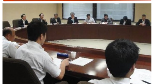
▲商店街活性化のプロジェクトチームでは委員長を務め、条例をまとめ上げました。