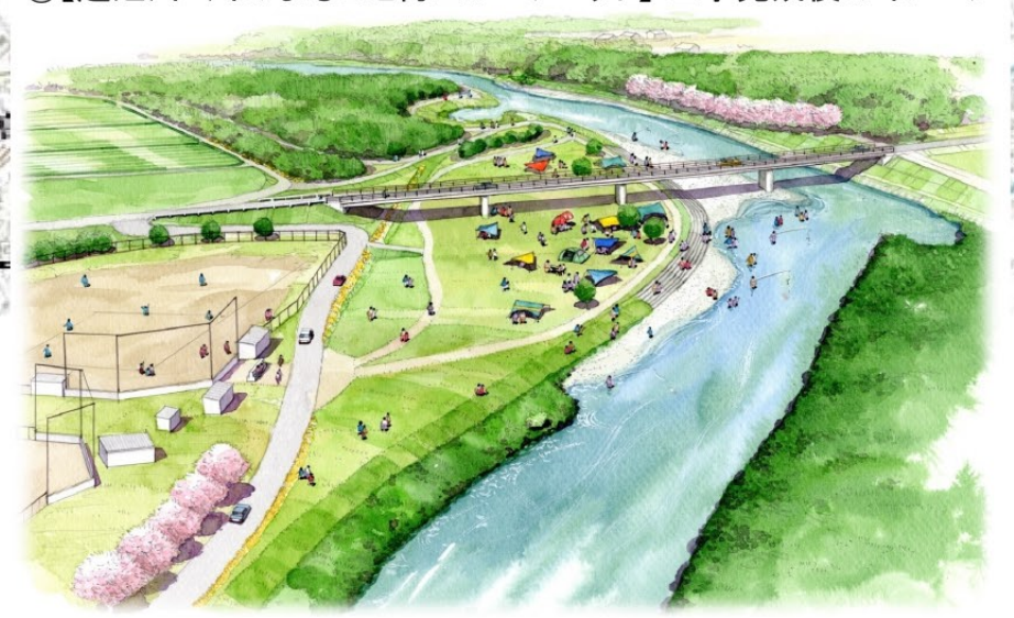
⑤【越辺川 川のまるごと再生プロジェクト】工事完成後のイメージ