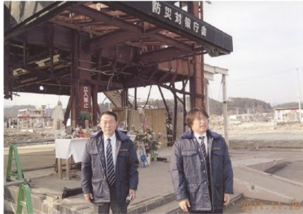
▲南三陸町防災対策庁舎を視察