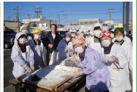
▲JAいるま野の収穫祭に参加