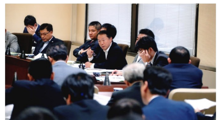
▲決算特別委員会での質疑の様子