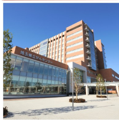
▲平成25年12月にオープンした県立がんセンター新病院