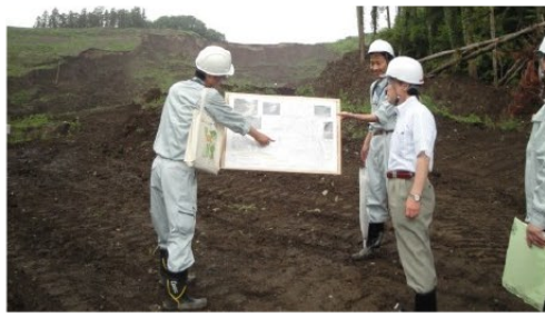
▲皆野町で起きた土砂崩落現場を視察