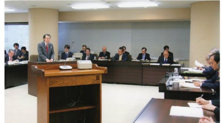
▲予算特別委員会の様子 知事に対して質疑を行いました。