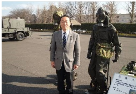
▲自衛隊大宮駐屯地(化学学校)を視察