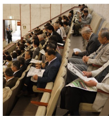
▲第1回目の議会傍聴に参加の皆さん