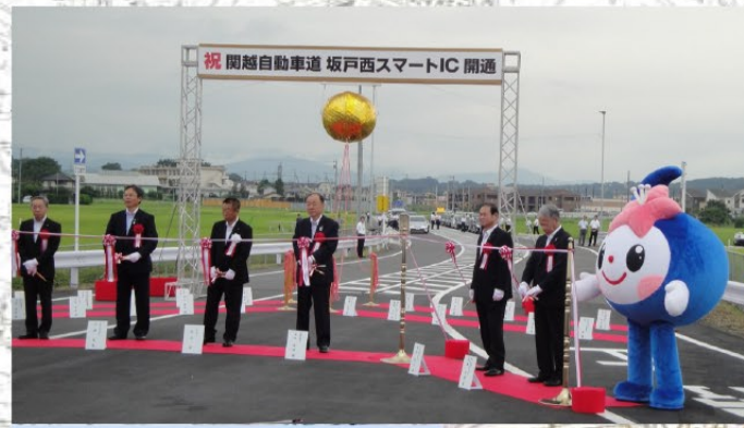
▲坂戸西スマートIC開通 (H25.8月)