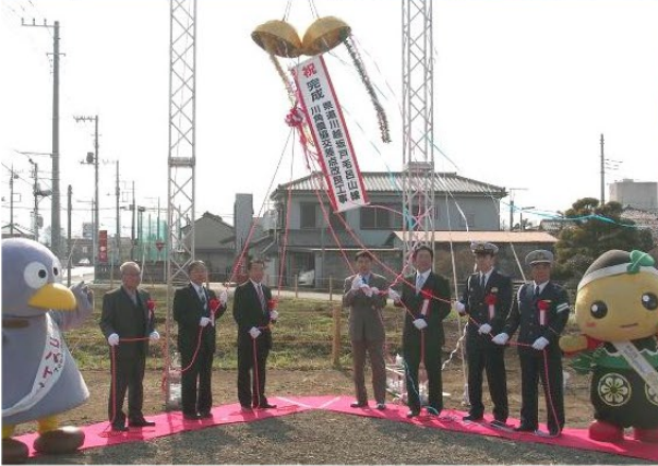
▲③川越坂戸毛呂山線川角農協交差点改良工事 右折帯完成により大幅に渋滞が緩和(H25.3月)